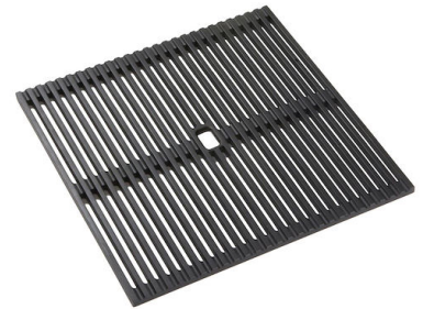
黑色网格 8100 606