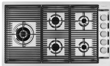
OUTLINE GAS 7440 000